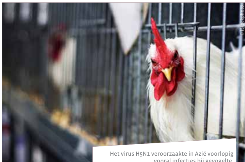
Het virus H5N1 veroorzaakte in Azië voorlopig vooral infecties bij gevogelte.

Dezelfde hoger vermeldde Nederlandse auteurs onderzochten het effect van verschillende mogelijke strategieën op het aantal ziekenhuisopnames en overlijdens. Vaccinatie zou meer dan 60% van de ziekenhuisopnames